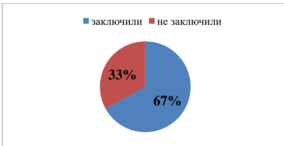
Рис.2. Заключение предварительных договоров работодателей со студентами в ходе проведения «Ярмарки вакансий – 2017»

рис.2.). В результате чего со 614 студентами, интернами и ординаторами была достигнута договоренность о будущем трудоустройстве.