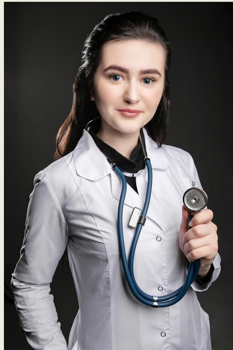
Фото должно быть качественным, официальным, без посторонних людей в кадре.

Резюме с фото соискателя более продуктивно и интересно работодателю.